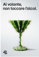
5.728 – Cocktail