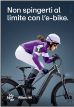
5.714 – Fantina