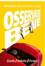
5.718 – Osservare bene