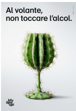
5.726 – Vino