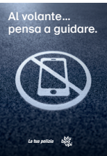
5.730 – Distrazione