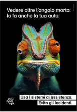
5.706 – Camaleonte