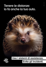
5.707 – Riccio