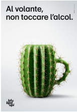
5.727 – Birra