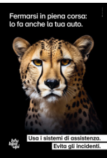
5.705 – Ghepardo