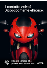
5.708 – Moto