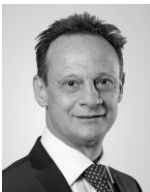
Stefan Engler Consigliere degli Stati CTT-S