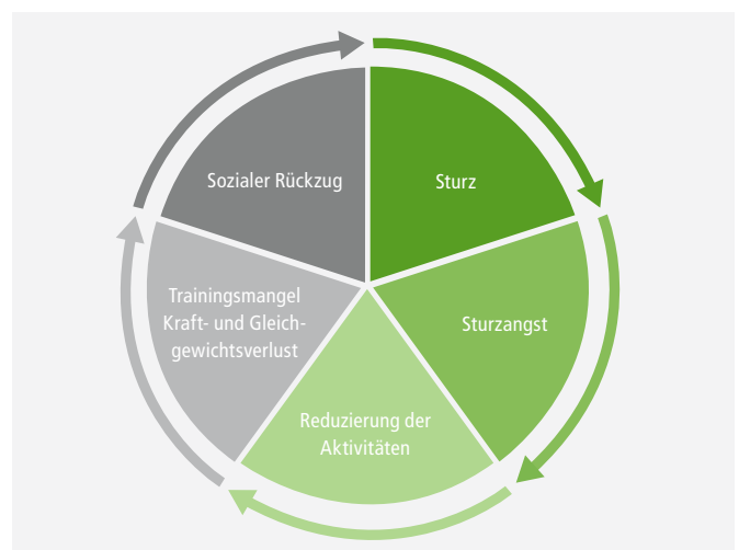
Negativspirale bei Post-Fall-Syndrom