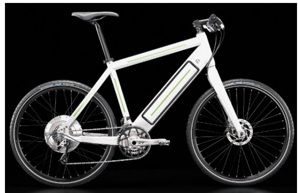
Abbildung 2 Elektrofahrrad mit im Rahmen integriertem Akku