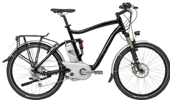
Abbildung 1 Übliches Elektrofahrrad

Elektrofahrräder sind Fahrräder mit zusätzlich eingebautem Elektromotor (Abbildung 1 und Abbildung 2). Ein Akkumulator, der üblicherweise am Rahmen befestigt ist, liefert die Energie. Die Reichweite der heutzutage im Handel erhältlichen Elektrofahrräder beträgt je nach Modell und zugeschalteter Leistung rund 30–80 km. Die Akkumulatoren lassen sich in der Regel bequem abnehmen und an herkömmlichen Steckdosen aufladen.