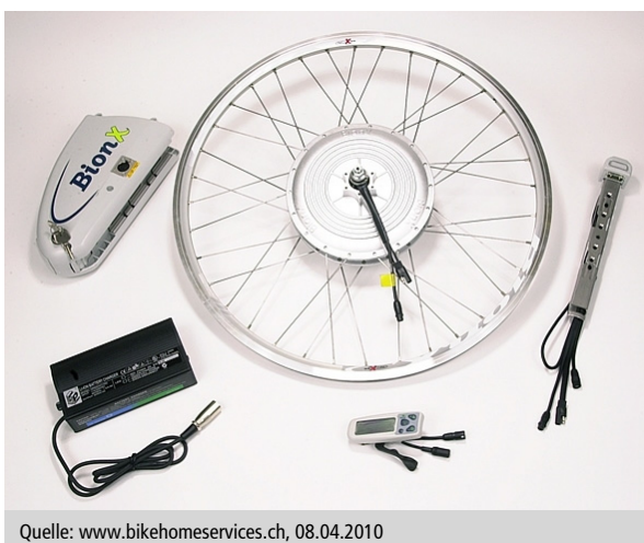
Abbildung 3 Umbausatz für herkömmliche Fahrräder

Es existieren verschiedene Prinzipien von Elektromotoren. Die sogenannten Tretlager-Motoren treiben direkt das Tretlager oder die Kette an. Ein anderes Prinzip sind die Naben-Motoren, wobei sowohl Vorder- als auch Hinterradnabenmotoren üblich sind. Diese können mit oder ohne Getriebe ausgeführt sein. Schliesslich finden sich auch Systeme mit Riemenantrieben. Der Markt bietet zudem Bausätze, die es ermöglichen, herkömmliche Fahrräder zu Elektrofahrrädern aufzurüsten (Abbildung 3).