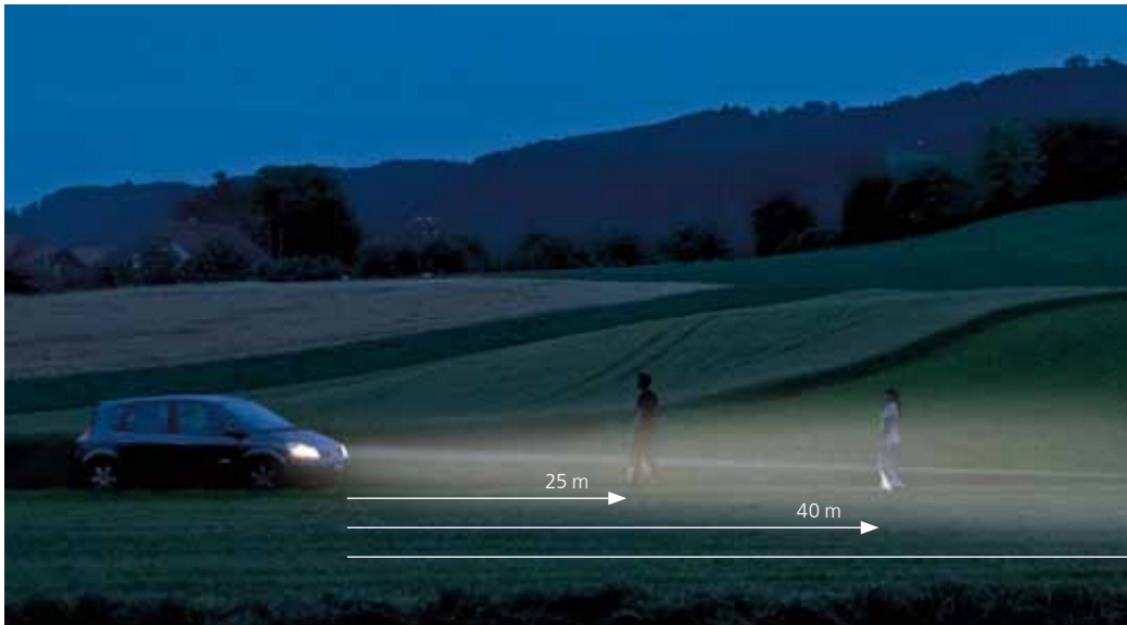
Bereits aus 140 m sichtbar – dank lichtreflektierendem Material

Mit dunklen Kleidern nimmt Sie eine Autofahrerin oder ein Autofahrer erst aus 25 Metern wahr – die Zeit für eine Reaktion ist zu knapp. Mit lichtreflektierenden Artikeln sind Sie bereits aus einer Distanz von 140 Metern sichtbar.