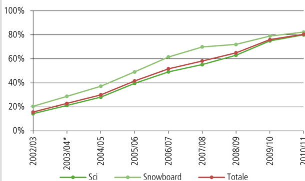
Figura 2 Tasso d'uso del casco tra sciatori e snowboarder secondo la stagione invernale, 2002/03-2010/11

La differenza nell'uso del casco tra i due sport è in continua diminuzione. Tra gli sciatori il tasso d'uso è aumentato di 5 punti percentuali all'80%, mentre tra gli snowboarder di 3 punti percentuali all'82%. Anche la differenza tra la Svizzera tedesca (85%) e la Romandia (67%) è diminuita. Nella Romandia, la percentuale d'uso è salita di 11 punti percentuali dall'ultima stagione invernale, mentre nella Svizzera tedesca è aumentata solo di 4 punti percentuali. Il tasso d'uso del paraschiena è sceso sia tra gli sciatori (-1 punto percentuale) sia tra gli snowboarder (-9 punti percentuali).