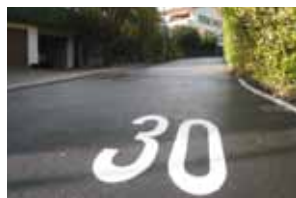
Zona con limite di velocità a 30 km/h