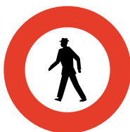
Divieto per pedoni