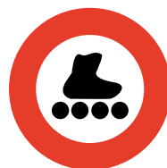
Divieto per mezzi simili a veicoli