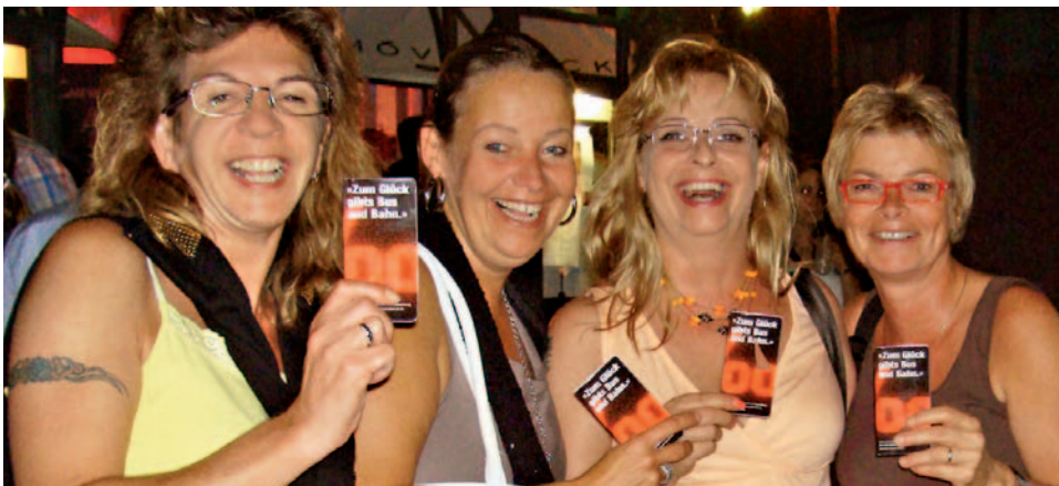
I biglietti gratuiti sono molto apprezzati dai frequentatori della Jazz Night di Zugo.

AZIONE BIGLIETTI GRATUITI Dopo l'introduzione del limite alcolemico dello 0,5 per mille, su mandato della comunità tariffale di Zugo le aziende di trasporti pubblici di Zugo hanno iniziato a distribuire una volta all'anno biglietti gratuiti per indurre i «nottambuli» a lasciare a casa l'automobile e utilizzare i mezzi pubblici. Un'iniziativa che sta coinvolgendo un numero crescente di imprese di trasporto.