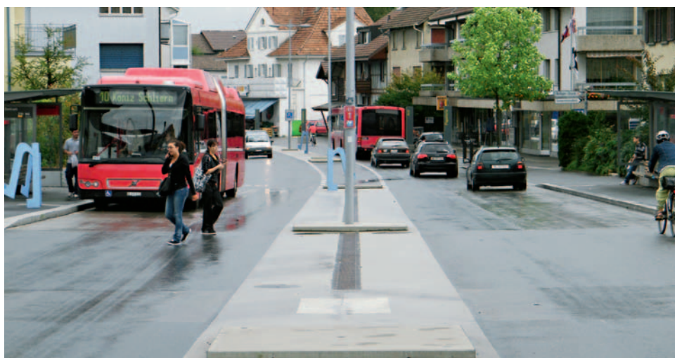
Un esempio riuscito di area di circolazione condivisa nel centro di Köniz (BE).