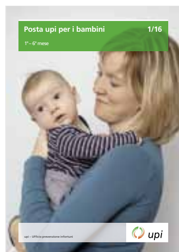
La posta upi per i bambini oggi.