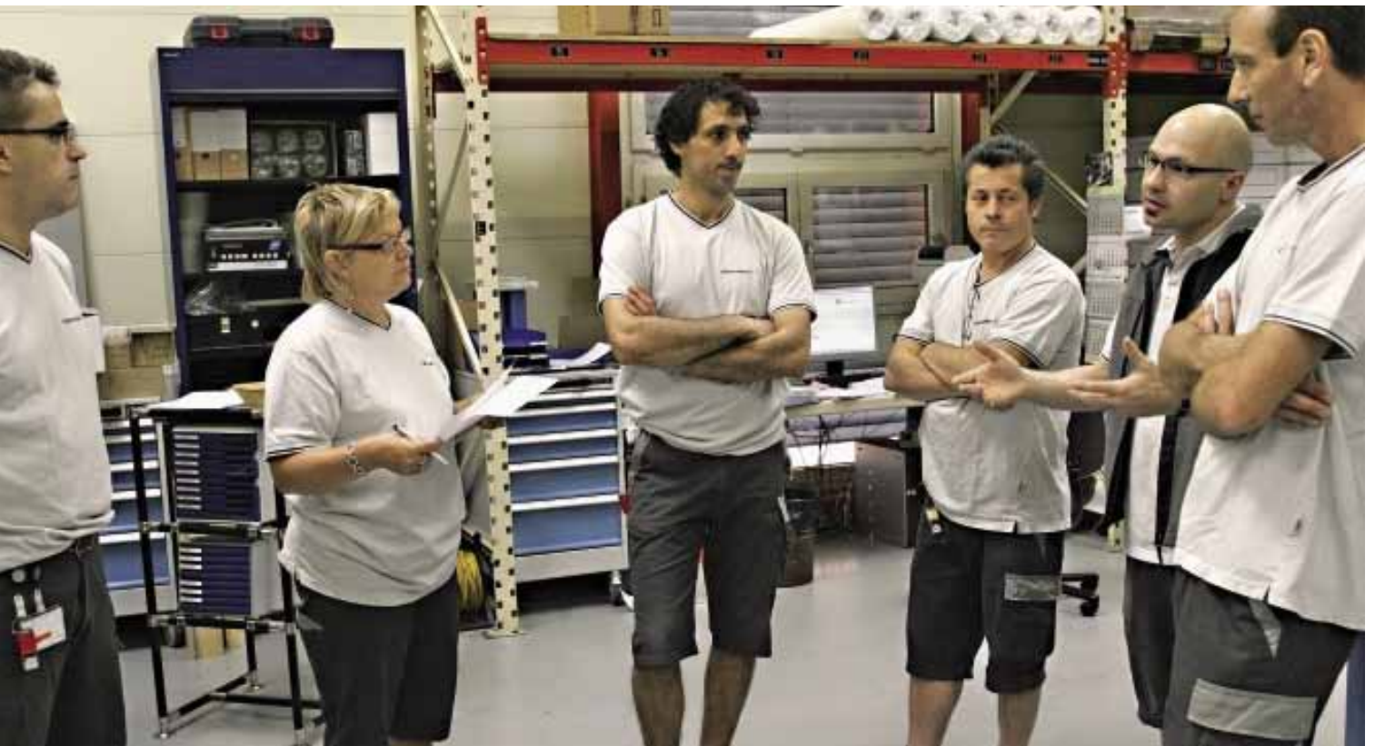
Il team della produzione nel suo incontro mensile, durante il quale si discute di un tema inerente alla sicurezza.