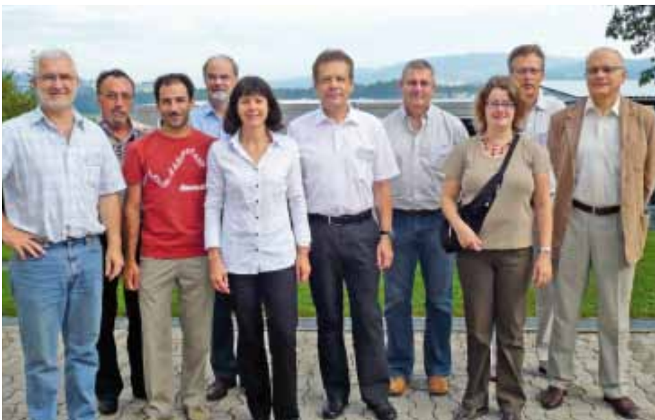
Fières de leur travail d'équipe, les succursales de Vevey et de Morges posent pour la photo-souvenir.

Dans un premier temps, les membres de l'équipe de l'entreprise fictive dénommée «Gusto Panetteria» ont fait connaissance, choisi en leur sein un responsable et ont mis sur la table la situation de départ. Il y avait du pain sur la planche: chaque groupe ou succursale de l'entreprise a dû analyser la statistique des accidents et déterminer les domaines prioritaires; les succursales avaient en effet des types de risques différents selon leurs emplacements et la composition du personnel. Tous les risques étaient représentés, de la chute aux accidents de circulation en passant par le football et le vélo. Il s'est donc agi, sur ces diverses données, de fonder un concept de campagne de sécurité, en particulier, de définir les groupes cibles, les objectifs, les mesures et les moyens de communication et de fixer le calendrier, le budget et les responsabilités. Les équipes disposaient de la documentation des campagnes du bpa et pouvaient en tout temps rechercher des informations spécialisées et des conseils sur un tableau d'information ad hoc. Les quatre succursales ne devaient pas omettre d'harmoniser leurs concepts,